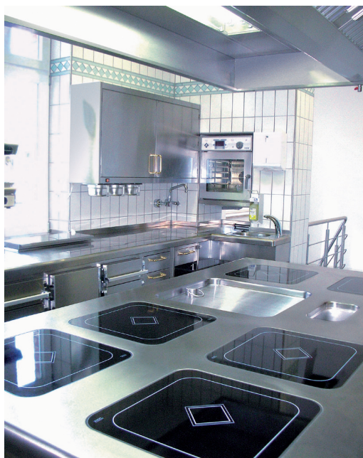
MKN-Küchenanlage mit Insel-Induktion und Griddleplatte. Im Bildhintergrund ein Handdampf Junior.