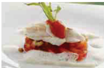
Ländlich-mediterrane Gerichte in Businessmenüs oder fürs elegante Dinner.