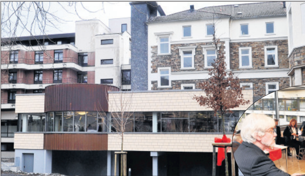
Nach einjähriger Bauzeit wurden Um- und Neubau von Küche und Speisesaal offiziell eingeweiht.