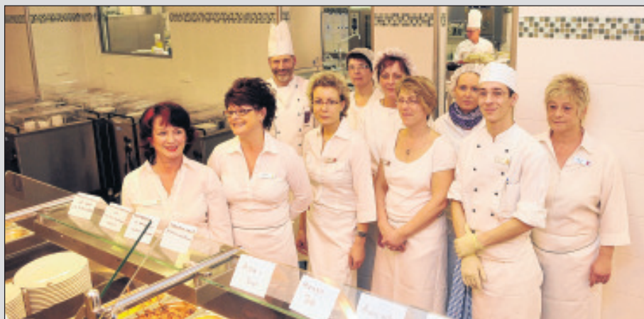
Zur Einweihungsveranstaltung wird ein Imbiss mit Produkten aus der neuen Küche gereicht.

die Klinik seit über 125 Jahren als Familienunternehmen mit großem Engagement geführt wird und betonte: „Es ist offensichtlich, dass Ihnen die gute psychiatrische, psychotherapeutische und psychosomatische Versorgung der Menschen in ganz Rheinland-Pfalz am Herzen liegt“.